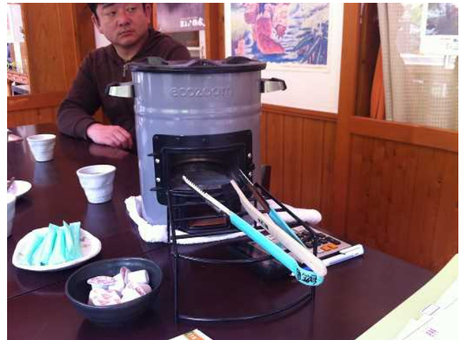
新型かまど、エコズーム