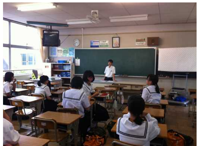
みんなに楽しんでもらえるような学年レクの企画