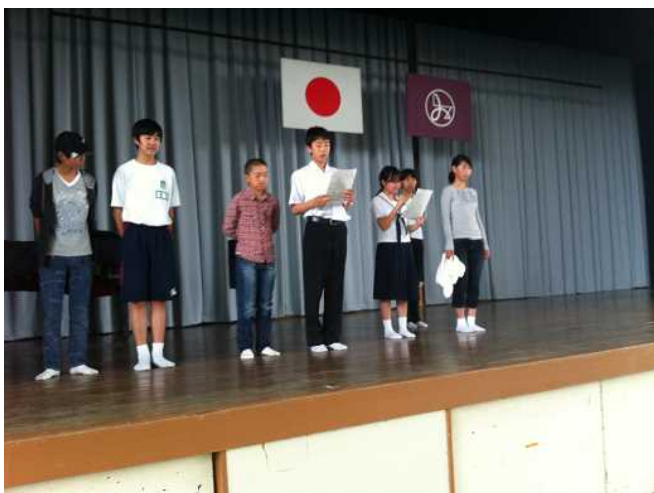
林間学習説明会の練習中