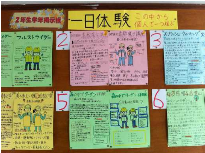
実行委員手作りの体験コース紹介