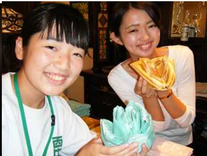
こんな素敵なクロスの飾りができました！！