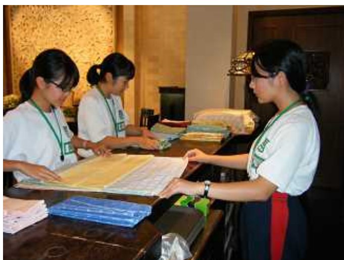
結婚式場にてテーブルクロスを飾り付けます。 →