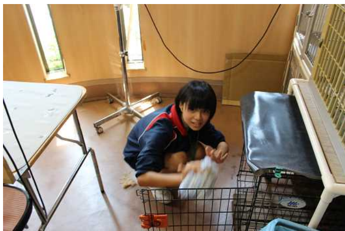
動物病院のケージの清掃も心を込めて

学校の日常生活と全く違う職場環境を体験して、みなさんは何を感じたでしょうか？ 大人の責任感、義務感、仕事のやりがいなどを少しは感じてもらえたでしょうか。ぜひ感じたことを西華祭で発表してください。