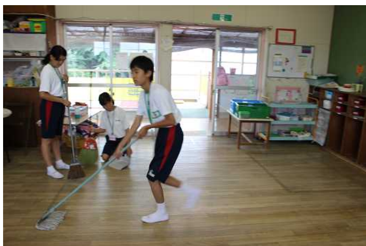
園児が帰った後の清掃、保育士の仕事を実感しました。