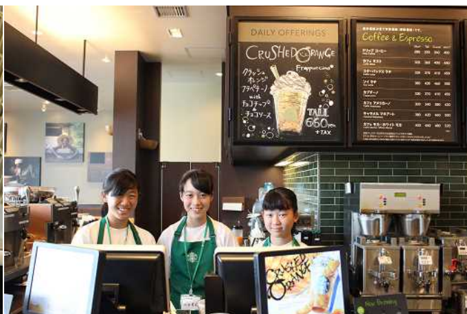
美味しいコーヒーはいかがですか？