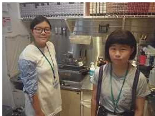
美容室の裏方の仕事を体験しました。