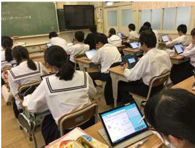
タブレットを利用してドリル学習