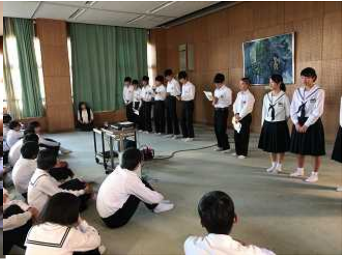
実行委員会の主催による合唱祭発表順抽選会