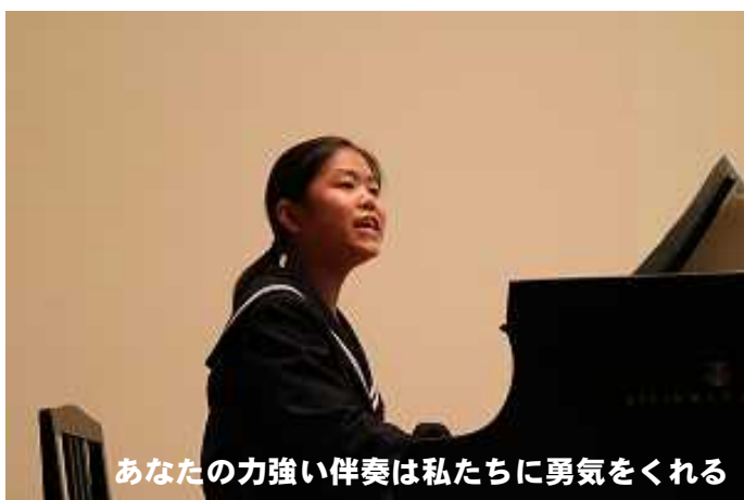
あなたの力強い伴奏は私たちに勇気を与える