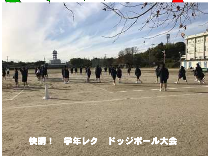
快晴！ 学年レク ドッジボール大会