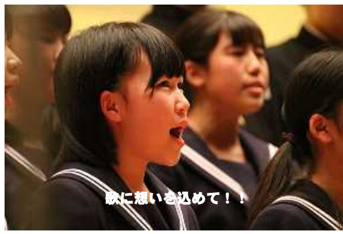
歌に想いを込めて！！