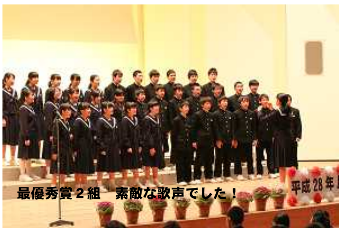
最優秀賞2組 素晴らしい歌声でした！ 平成28年