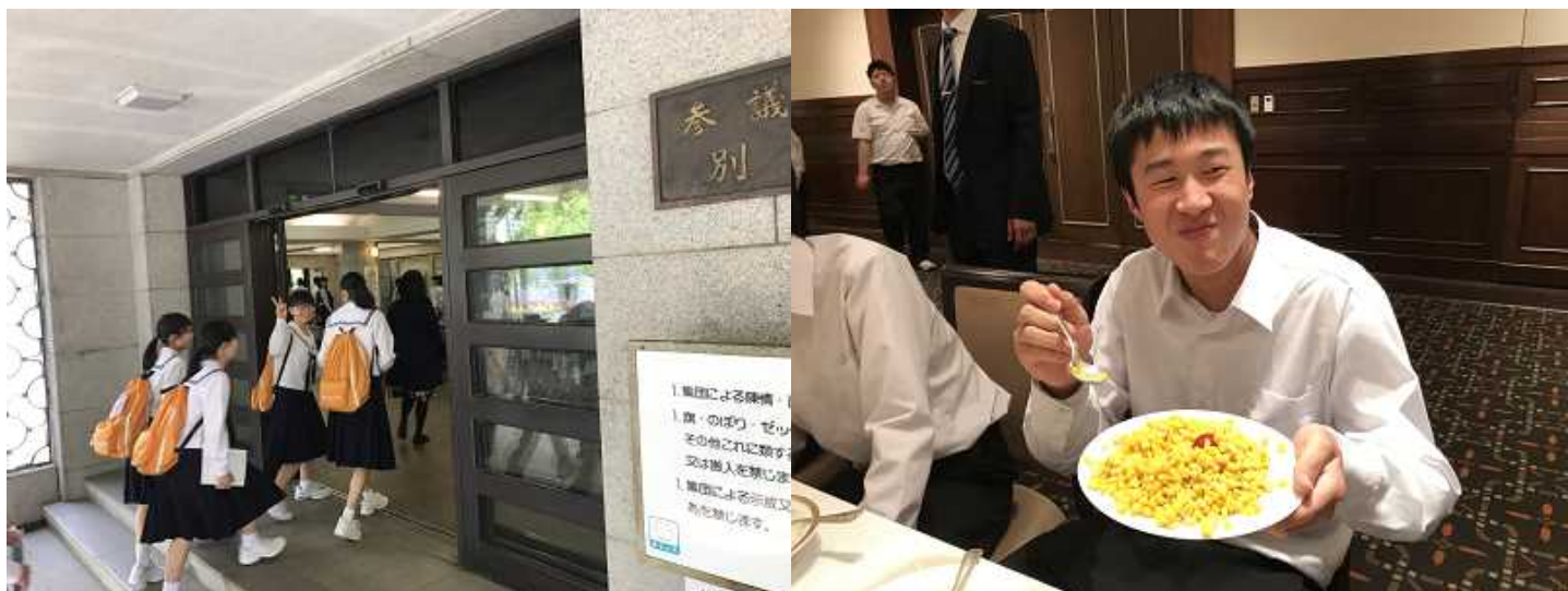
いざ国会へ、法案審議の仕組みを学びます

5月11日～13日 東京・伊豆方面修学旅行 L3 (Look! Learn! Laugh!) いっぱい見て、いっぱい学んで、いっぱい笑いました！ みんなのたくさんの笑顔が最高にステキでした。