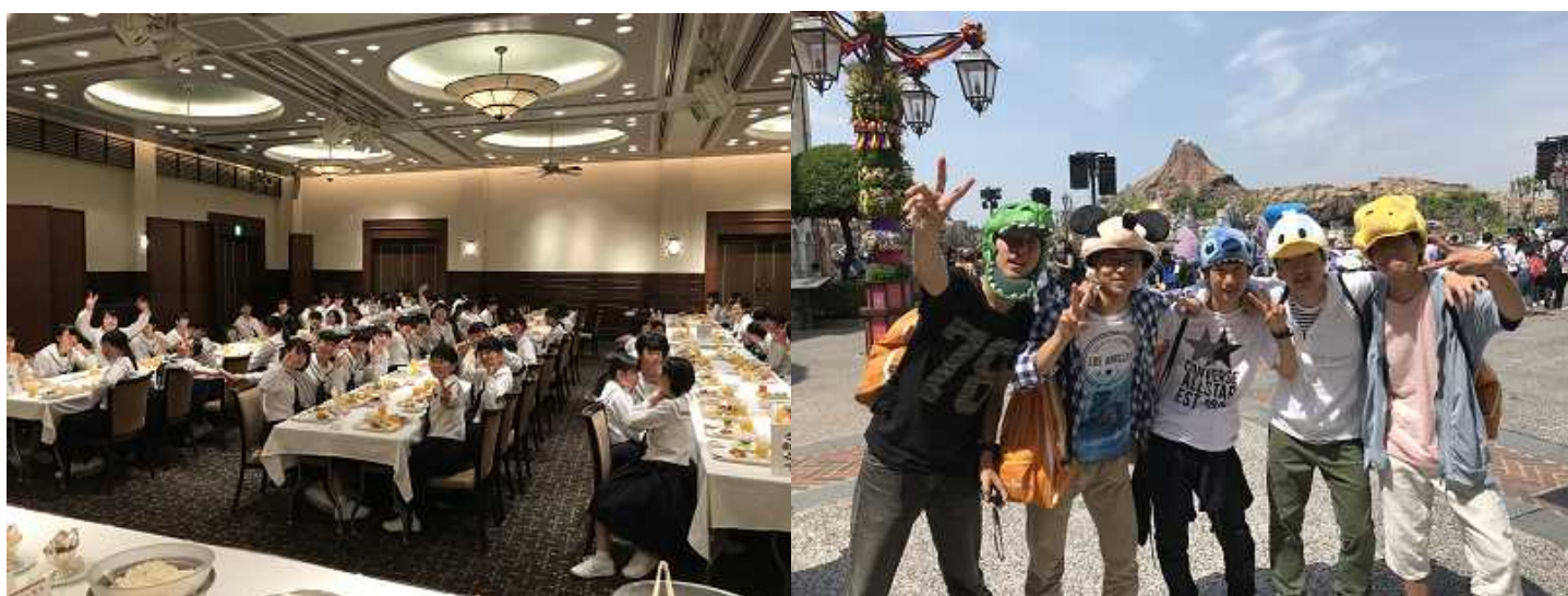
みんなと食べるディナーは最高！！