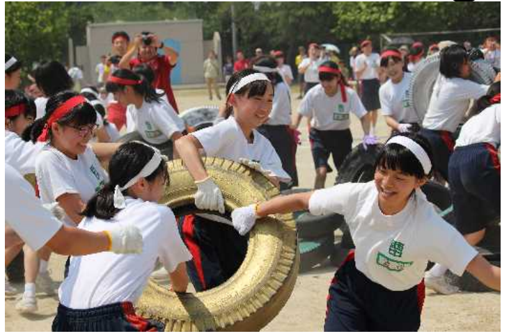
金タイヤは最高得点!野生に返って奪え!