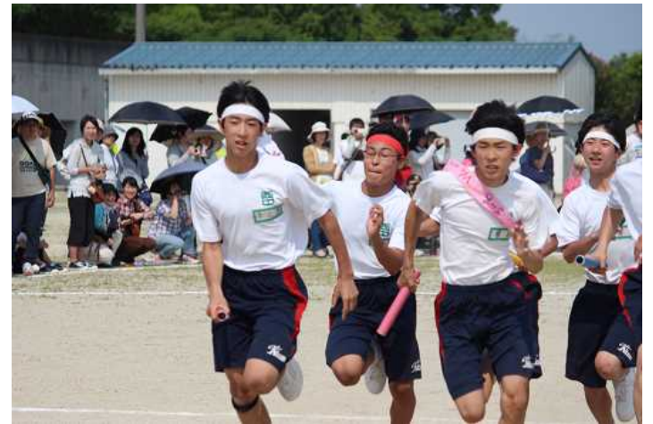
激走!! クラスの名誉を背負って!!