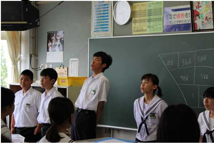
応援団練習、後輩指導にも熱が入ります!!

スポーツ祭 バランスボール送り 1位4組 2位5組 3位3組 タイヤを引きタイヤ 1位5組 2位2組 3位1組 野生に返れタイヤ争奪戦 1位5組 2位1組 3位6組 応援合戦 優勝白組 2位赤組 なわ!とべ!! 1位4組 2位3組 マンモスリレー 1位5組 2位4組 総合優勝 白組 学年総合 1位4組 2位5組