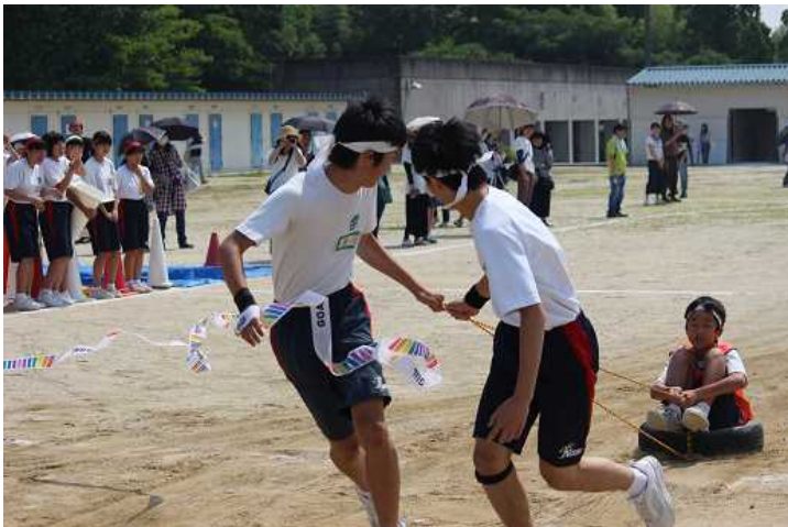
栄光のゴールテープを切る5組!!