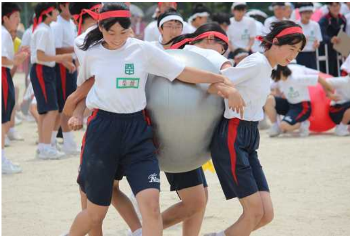
新競技バランスボール送り このボヨンボヨン感が最高!