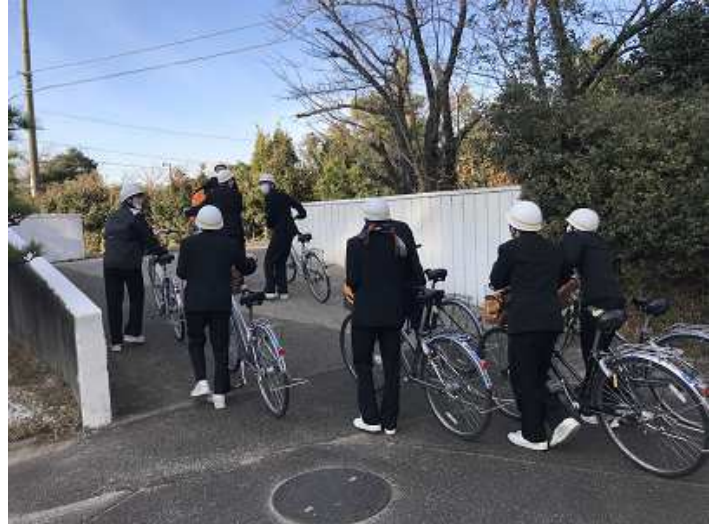
朝出発組は8時30分ごろ学校を出ました