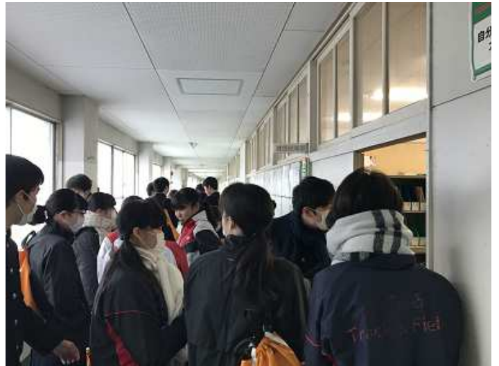
進路室前に集まり人数確認