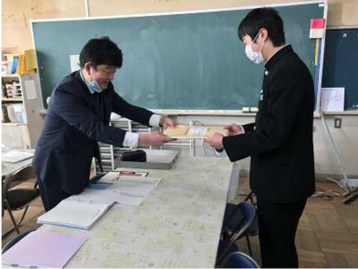
願書等関係書類を受け取ります