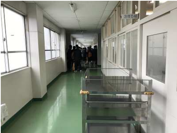
午後出発組は給食後に集合しました