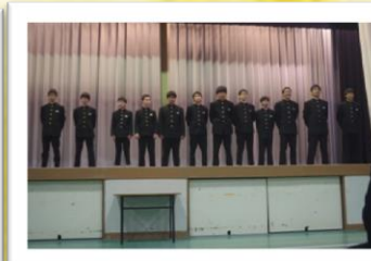
男子バスケット部